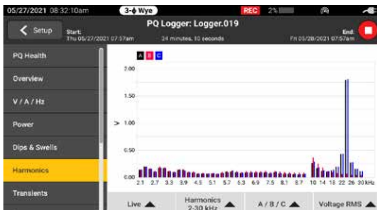
从前 50 个整数谐波以及从 2 kHz 到 30 kHz，可提供全范围谐波

Fluke 1770 系列的设计是为了让用户在任何测量环境中都能安全轻松地使用。1770 系列允许您捕获各种电能质量变量以及高速波形、高速瞬变和更高频率谐波，所有这些数据均可在高分辨率大屏幕上即时查看。这些分析仪具有非常出色的 CAT IV 600 V / CAT III 1000 V 过电压额定值，可在进户线或下游使用，测量交流和直流输入以及高达 30 kHz 的谐波。使用 1770 系列，您可以满怀信心地捕获所需的数据，无论任务如何，都能做出更好的维护决策。