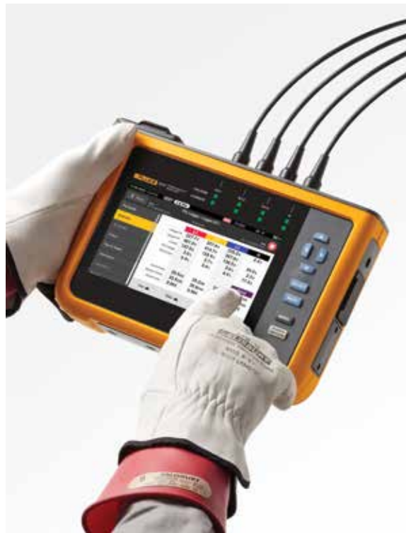
使用大尺寸彩色触摸屏轻松导航

从 Fluke 1770 Series Power Quality Analyzers 下载数据时, 随附的 Energy Analyze Plus 软件包可将电压测量值和电流谐波统计数据与不同标准 (如 EN 50160 或 IEEE 519) 进行比较, 以确定它们是否超出合规性限制。这种强大的预测性维护功能可让您在电压出现失真之前观察到电流谐波, 从而防止意外故障或不合规情况, 延长系统正常运行时间。随着基于逆变器的负载和发电的激增, 控制电流谐波变得越来越重要, 这有助于确保可靠的电能质量并避免系统停机。