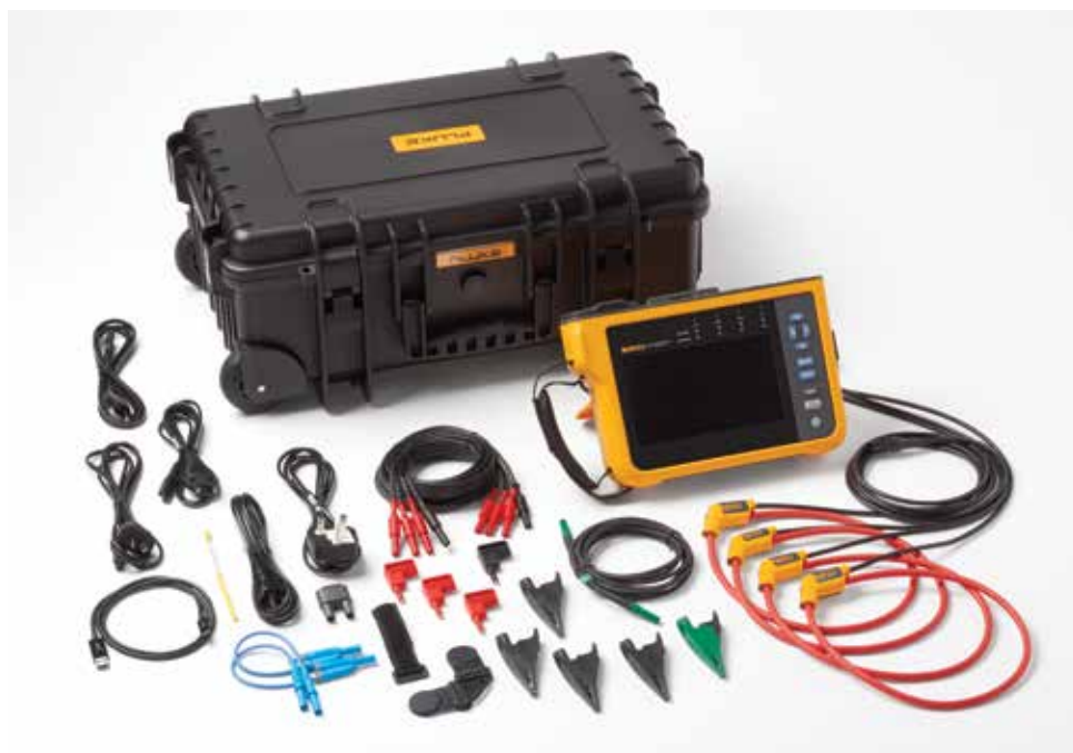
Fluke 1777 Power Quality Analyzer。注意：随附物品因型号而异，并在“订购信息”表中列出。