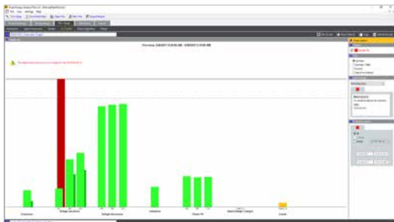
Fluke Energy Analyze Plus: 电能质量状况概览